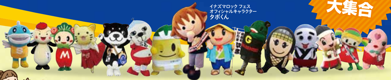
イナズマロックフェス オフィシャルキャラクター タボくん

我こそ! という飲食店43店舗が出店し、ご来場様に一番美味しかったお店に専用コインを投票していただき、20位以内に入賞した飲食店が9月16、17日に鳥丸半島で行われるイナズマロック フェス 2017のフリーエリアに出店出来るという前哨戦イベントです。もし金券が余った場合は9月末まで滋賀県内の出店者の実店舗でお使い頂けます。(実店舗で金券が利用できる店舗は裏面をご覧ください。)