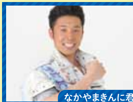
なかやまきんに君